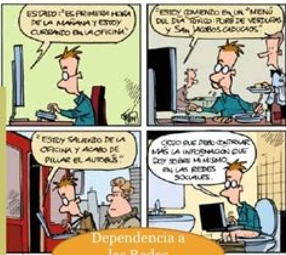
Dependencia a las Redes Sociales